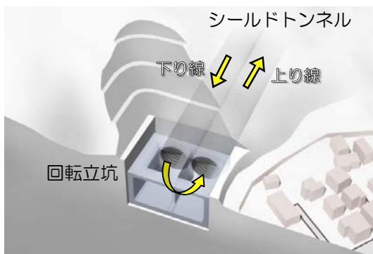
回転立坑イメージ