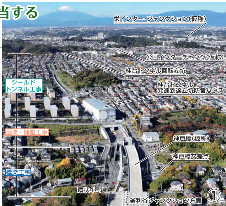
上郷桂台工事区の全景