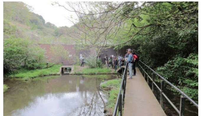
◎新ひょうたん池 希少動植物が息していた「ひょうたん池」の代替池として移設した箇所を散策し、それらの生息環境を改善するための取り組みについて紹介します