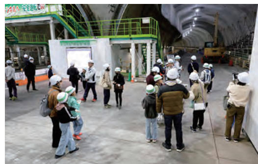
桂台トンネル回転立坑での現場見学会(令和6年12月7日)

工事期間中はご迷惑をおかけしますが、安全・安心を第一に工事を進めてまいりますので、ご理解とご協力をよろしくお願いいたします。