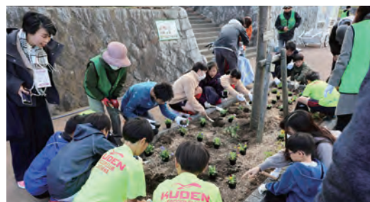
「湘南桂台みどりの会」主催の花植え式に参加し、「NEXCOの花」を提供して、子供たちと一緒に花を植えました(令和6年11月9日)