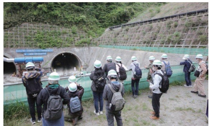
◎釜利谷開口部 釜利谷ジャンクションの改変面積の縮小 釜利谷西トンネルを見ながら、従来の自然環境を極力残すために切土構造からトンネル構造へ変更した場所を見学します