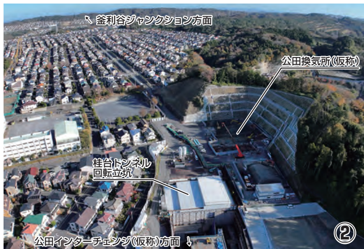
公田インターチェンジ(仮称)側から釜利谷ジャンクション方面