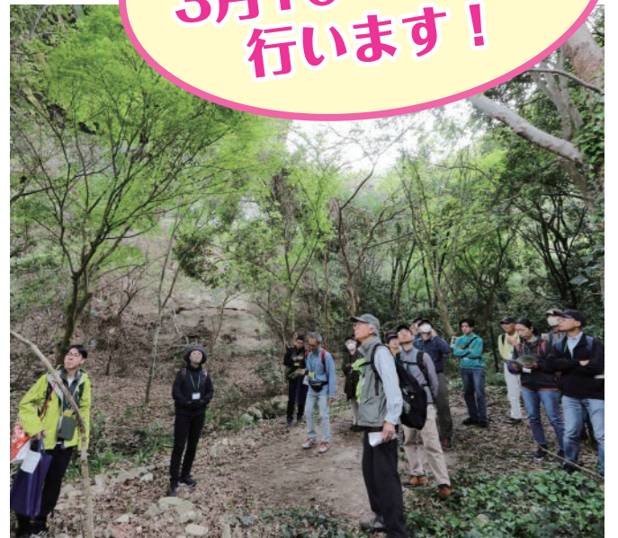
◎釜利谷第二高架橋ビオトープ 高架橋の下はビオトープ(さまざまな動植物が息できる空間)として整備されています。通常高架下は砂地になることが多いですが、こちらは常緑、落葉など様々な樹木が生育しています

エコハイク専用受付フォーム二次元コード https://form.e-nexco.co.jp/m/ecohaiku