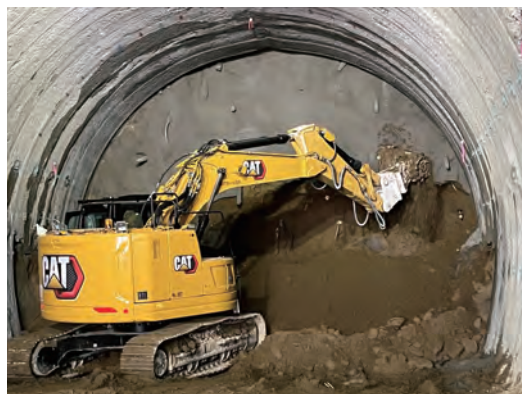
Hランプ第二トンネル掘削状況