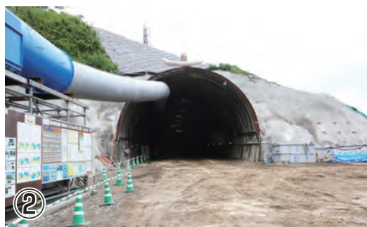
Hランプ第二トンネル坑口

Hランプ第二トンネルについては、今年の4月に掘削を始めています。鉄塔の方へ掘り進めますので、慎重に掘削を進めています。