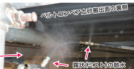
霧状(ミスト)の散水

シールドトンネルでは、ベルトコンベアによる掘削土の搬出を行っており、トンネル内で粉塵が飛散しないよう、ベルトコンベアの裏側に霧状(ミスト)の散水をしています(桂台トンネル工事)