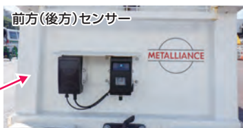
前方(後方)センサー