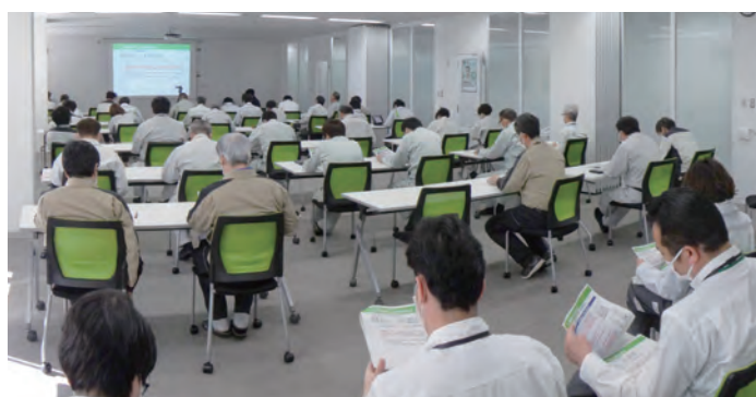
横浜工事事務所における安全講習会