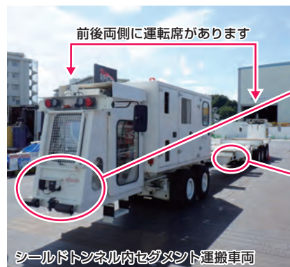
前後両側に運転席があります

工事の仮設物で暗くなっている歩行者用通路をLEDチューブライトで案内しています(神戸橋(PC上部工)工事)