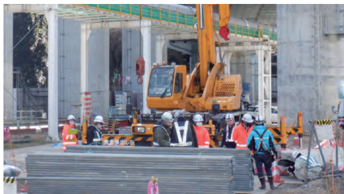
工事現場における安全巡回(釜利谷ジャンクション)