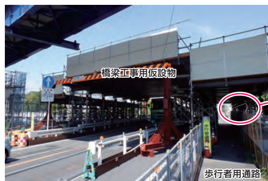
橋梁工事用仮設物

一般の歩行者が通る通路の工事用防護柵では、中段の鉄板部の隙間に、歩行者が手を入れて怪我をしないよう、保護しています(公田インターチェンジ工事)