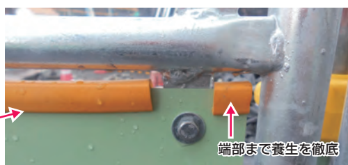
端部まで養生を徹底

一般の歩行者が通る通路の工事用防護柵では、中段の鉄板部の隙間に、歩行者が手を入れて怪我をしないよう、保護しています(公田インターチェンジ工事)