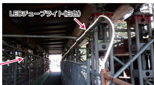
LEDチューブライト(白色)

工事の仮設物で暗くなっている歩行者用通路をLEDチューブライトで案内しています(神戸橋(PC上部工)工事)