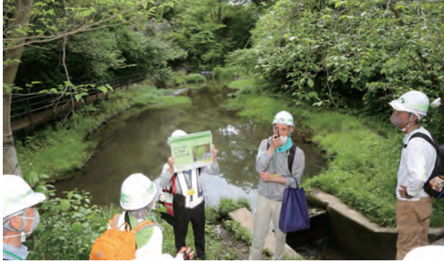
○新ひょうたん池 希少な動植物が生息していた「ひょうたん池」の代替池として整備しました。現在は、周辺の動植物が生息できる良好な水辺環境を保っています。今回の「エコハイク」の時期は、新緑が見ごろとなっています