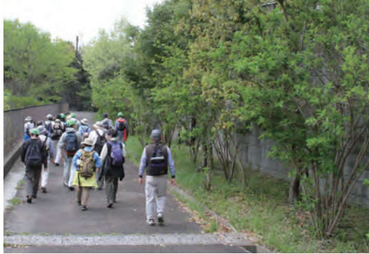
○地域性苗木の植樹 よこかんみなみでは、沿線地域にある樹木の種子から育成した苗木(地域性苗木)による植樹を計画しています。「エコハイク」では、地域性苗木を用いた早期緑化の計画をご紹介します