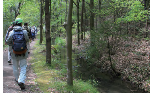
○ホタル水路 ホタルの生態に合わせて水路の流れを調整したり、周辺は適度な日陰となるように整備しました。6月下旬ごろには、多くのホタルを観察することができます