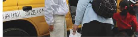
NEXCO東日本の黄色のパトロールカーも一緒に参加。子供たちに大人気でした

11月18日(土)に行われた「栄区民まつり」に、NEXCO東日本として、ブースを出展しました。NEXCO東日本のブースでは、パネルなどで会社の事業を紹介したり、高速道路を管理しているパトロールカーなどを展示し、多くの方に来場していただきました。