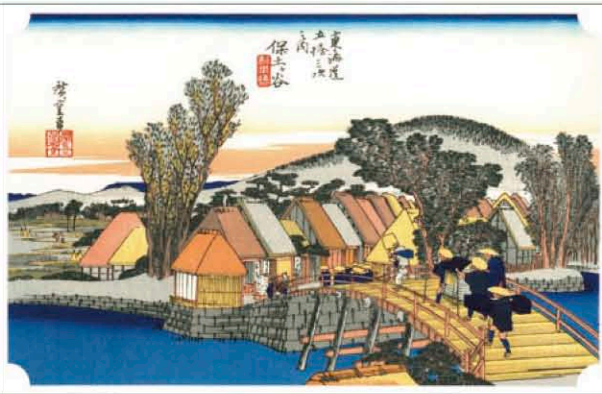
歌川広重「東海道五拾三次之内 保土ヶ谷 新町橋」©東京伝統木版画工芸協同組合