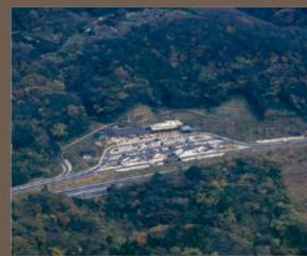
横須賀PA(下り線)完成