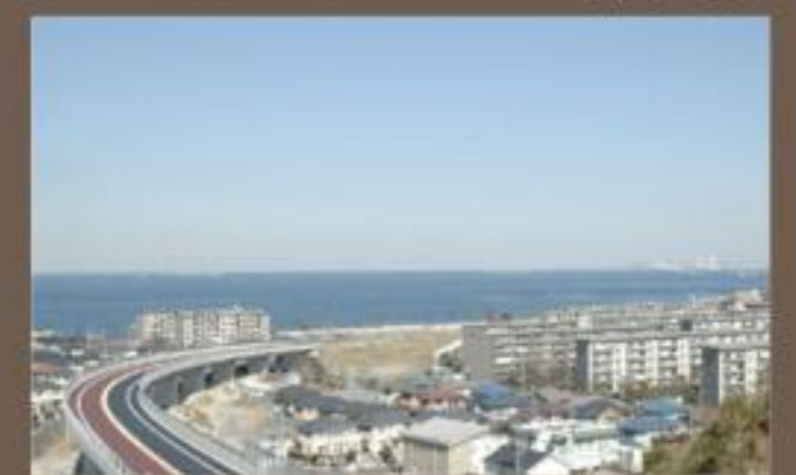
馬堀海岸IC付近 開通を待つばかりの馬堀海岸IC付近。馬堀海岸が見える絶景ポイント