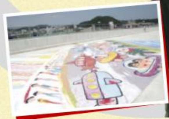
[あなたが描く横須賀 未来の道] 最優秀賞