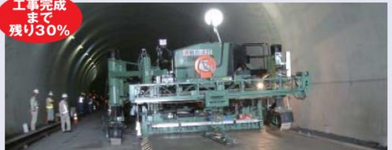
■横浜横須賀道路の延伸について http://www.yokokan-minami.com/yokoyoko/index.html