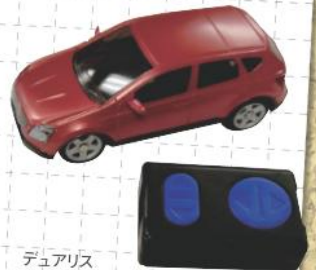
デュアリス 日産オリジナル赤外線コントロールカー 5名様 ※写真はイメージです

アンケートにお答えいただいた方の中から抽選で、日産追浜工場からご提供いただいた「デュアリス 日産オリジナル赤外線コントロールカー」をプレゼント! ハガキに必要事項をご記入のうえ、2008年11月30日までにご応募ください(当日消印有効)。なお、当選者の発表は賞品の発送をもって代えさせていただきます。皆様のご応募をお待ちしています。