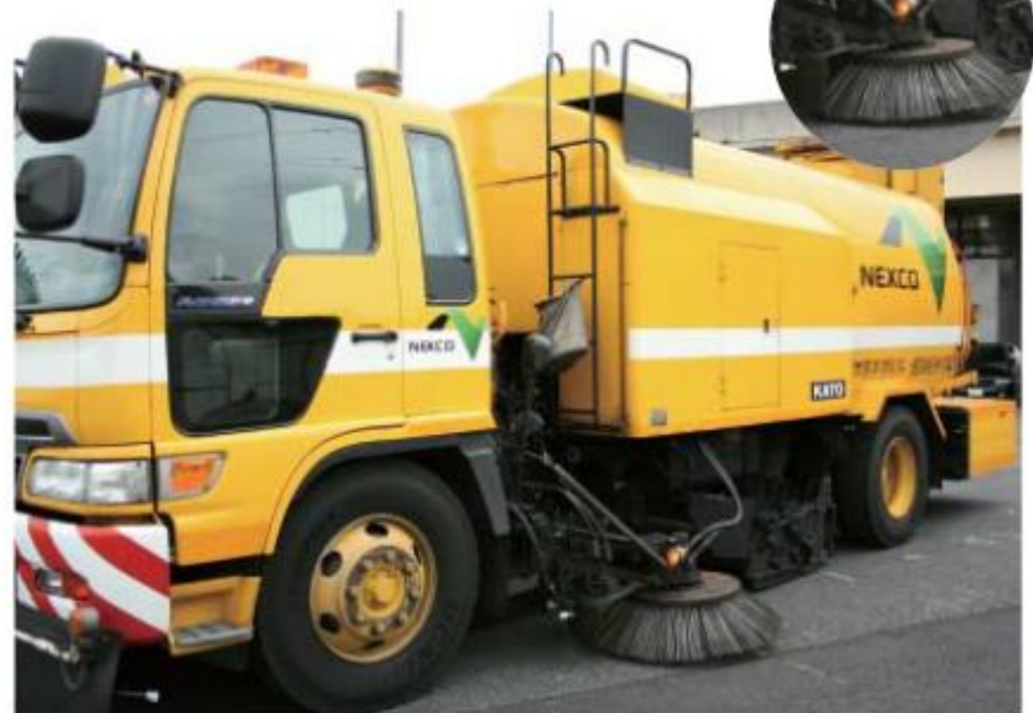
道路の上に落ちているゴミを掃除する車です。高速で回転するブラシを使ってゴミを回収します