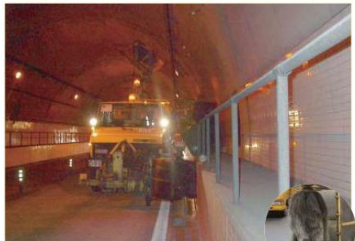
トンネル内の道路の上に落ちているゴミやトンネルの壁を専用ブラシを使って掃除する車です