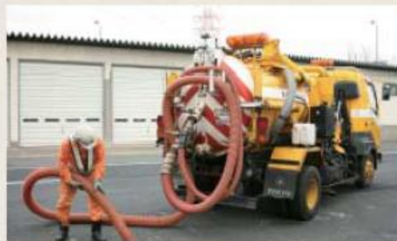
排水施設を掃除する車