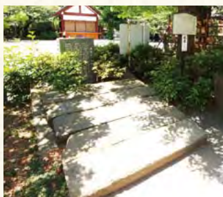
▲小土呂橋の親柱は別の場所で保存されています

その一方で、川崎宿の人々の生活は苦しいものでした。江戸から近い川崎宿に宿泊する人は少ないために、収入が少ないにもかかわらず、荷物の運搬のための伝馬役で馬や人足の負担が地元にも重くのしかかり、豊かな