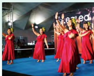
▲広いホールで行われる様々なイベント。なかでもフラダンスの華やかさは抜群です

かつて港ヨコハマの発展を牽引した大さん橋は、独自の発展を遂げ様々な顔を持つようになった横浜の各地域を結びつける役割を、今また果たそうとしています。