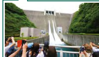
お待ちかねの放流スタート!

戻りは遊覧船「みやがせ21」でのんびりと。鳥居原園地行きの便は1日1本程度しかないので、乗り遅れ注意です。まだ体