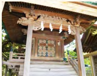
▲見事な彫刻が施された子神社