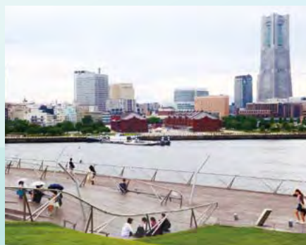
▲海風が心地よい大さん橋屋上

大さん橋ふ頭はその後1964年の東京オリンピックに合わせ客船ターミナルを備えた本格的な客船ふ頭へと大変身、さらに築100年を期にリニューアルされ、2002年日韓サッカーワールドカップに合わせて、横浜港大さん橋国際客船ターミナルがオープンしました。赤レンガ倉庫や山下公園の目の前、海に浮かぶ大さん橋に行ってみましょう。大さん橋国際客船ターミナルは一日24時間開放されていて入場無料。海に向かってゆったりと山なりに浮かび上がる姿はまるで大きなクジラの背中のようなです。歩くと心地よいウッドデッキで覆われていて屋上庭園には天然芝、格好のお散歩コースなので、ぶらりと立ち寄るハマ