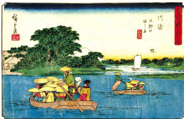
歌川広重「東海道五十三次之内 川崎 六郷の渡し」 慶應義塾所蔵

東日本高速道路株式会社の英語表記「East Nippon Expressway Company Limited」の頭文字から生まれたブランドネームです。また、同時に私たちの姿勢や熱意を示した「みち」の先へを示す「Next(次なる)」と、「Co(共に)」を意味する接頭語の2つの言葉を含んでいます。