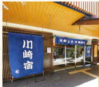
▲東海道かわさき宿交流館では往年の川崎宿の様子を体感できます

自分たちの手で地元を守るという川崎の人々の気概と、「民のために」という休愚の祈りを稲毛神社を訪れると感ずるのです。