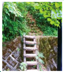
起伏が激しい道程です