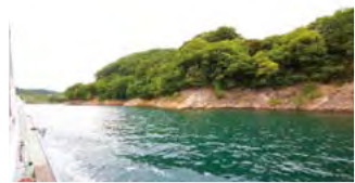
湖面を渡る風が気持ちいい!