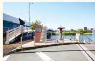
▲現在では立派な橋がかかる六郷の渡し跡

入るだけで、真に民のために使われない」と告発した酒匂川の治水や二ヶ領用水の修復などを自ら手掛け、多くの功績を残しました。