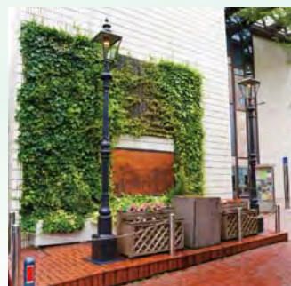
▲1872年馬車道に立てられた日本最初 のガス灯が復元されています

なるべく海外との接触を避けたい幕府の思惑をよそに、開港された横浜には舶来の文物、文化が滝のように流入します。パンに牛乳、コーヒー、ビール、ガス灯に電信、ドレスにアイスクリーム…。横浜ではたくさんのものが日本で初めて作られました。時代が明治に代わっても横浜は舶来文化の発信地であり続け、横浜に流れ込んだ舶来文化はこの地の人や風土と調和し、独自の横浜文化に成長して、現在も日本をリードしています。