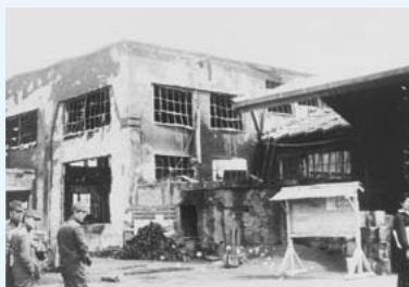
▲戦災で壊滅的な被害を受けた横浜工場と在りし日の姿(上)