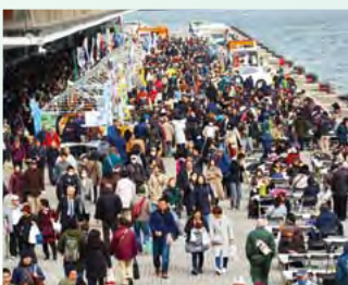
▲大さん橋マルシェではイートインスペースが設けられており、老若男女で賑わいます

気が高まり、昨年度のクルーズ人口は約25万人と過去最高を記録しました。「休暇が短く、皆が同じ時期に一齐に休む習慣がある日本には、ゆったりしたクルーズの旅はなじまないと思われてきましたが、渋滞にはまることもすし詰めになることもなく、移動時間そのものを楽しみながら目的地に行けるクルーズこそ、これからの休暇の過ごし方には最適だと思います。価格的にも大分手頃になってきましたし、日本船籍のクルーズ船を選べば日本人が大好きな展望大浴場も完備していますね」敷居の高い「ドレスコード」もカジュアルでOKの場合やインフォーマルまで大丈夫、など初めてでも安心なツアーが増えています。「ドレスコードを厄介だと思う方も多いですが、考えようによっては、普段陸の上ではめったに着る機会のないドレスを堂々と着ておめかしできる非日常体験です。楽しまなくてはもったいないですよ、クルーズは社交の場なのですから。」多くのクルーズ客を見守ってこられた今村さんは、新しい人の