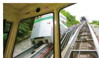
急勾配を行くインクライン

葦尾根と県立あいかわ公園の分岐を『あいかわ公園(1.6km)』方面へ向かいます。足元は角材を使ったしっかりした階段で歩きやすく、どんどん下っていきますが、膝に負担がかかります。やがて花の森と冒険の森どちらに行くかの分岐です。いずれも