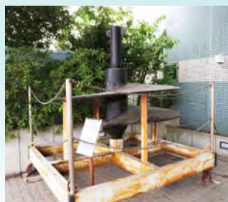
▲100年間初代大さん橋を支えていた 螺旋杭。人力で埋め込まれたそうです

大さん橋ふ頭はその後1964年の東京オリンピックに合わせ客船ターミナルを備えた本格的な客船ふ頭へと大変身、さらに築100年を期にリニューアルされ、2002年日韓サッカーワールドカップに合わせて、横浜港大さん橋国際客船ターミナルがオープンしました。赤レンガ倉庫や山下公園の目の前、海に浮かぶ大さん橋に行ってみましょう。大さん橋国際客船ターミナルは一日24時間開放されていて入場無料。海に向かってゆったりと山なりに浮かび上がる姿はまるで大きなクジラの背中のようなです。歩くと心地よいウッドデッキで覆われていて屋上庭園には天然芝、格好のお散歩コースなので、ぶらりと立ち寄るハマ