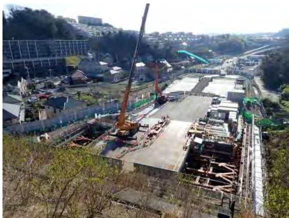
全景写真（仮栈橋工）