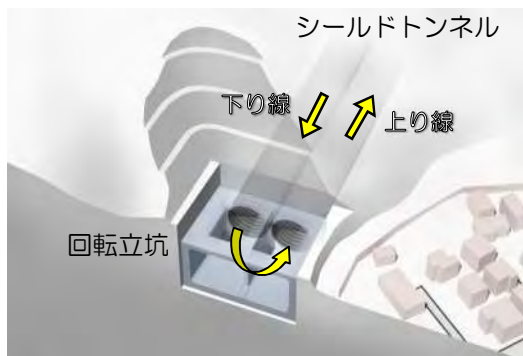
回転立坑イメージ