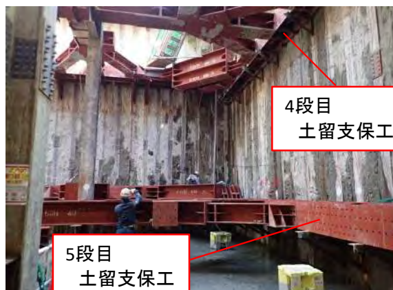
施工現場写真(山留支保工)(地下約11.7m)