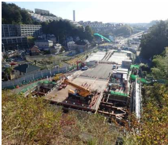
全景写真（仮栈橋工）