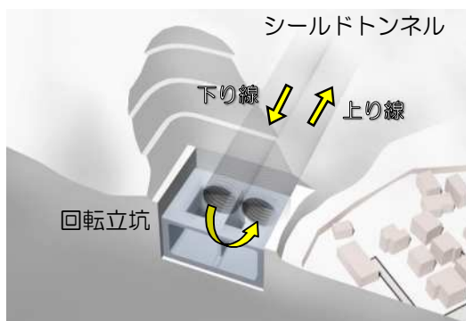
回転立坑イメージ