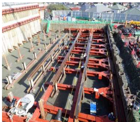
施工現場写真（山留支保工）