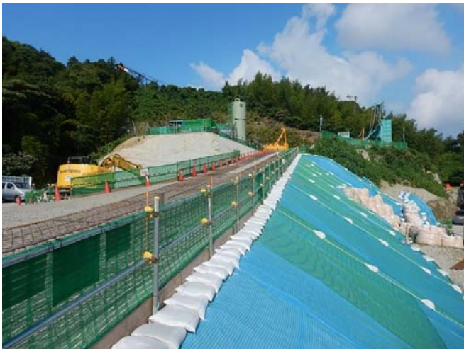
写真A 回転立坑進入路