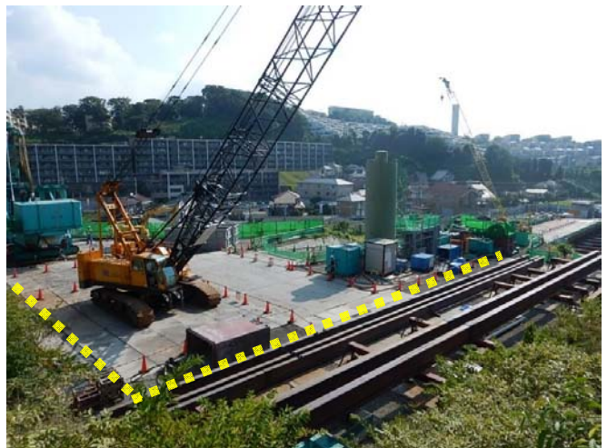
写真B 回転立坑ヤード 等厚式連続壁施工 平成29年8月撮影