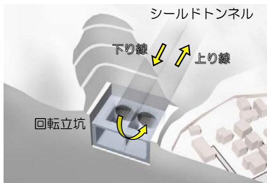
回転立坑イメージ