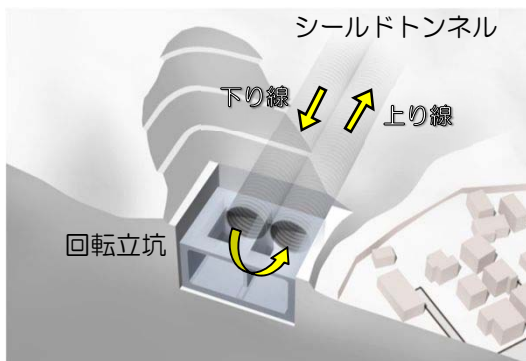
回転立坑イメージ