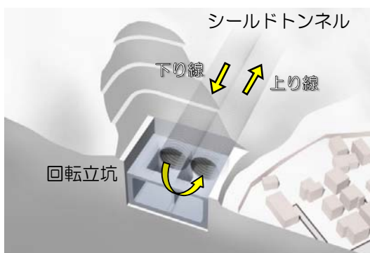
回転立坑イメージ