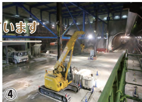
④ 釜利谷ジャンクションCランプトンネル工事 防音ハウス内部。右奥がパイロットトンネル坑口

横浜環状南線(よこかんみなみ)では、下図の青字の工事を進めています。関係する地域にお住まいの皆さまには、工事期間中、ご迷惑をおかけいたしますが、安全第一で工事を進めてまいりますので、ご理解とご協力をよろしくお願いいたします。