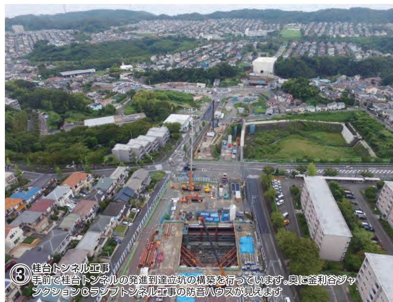
③ 桂台トンネル工事 手前で桂台トンネルの発進到達立坑の構築を行っています。奥に釜利谷ジャンクションCランプトンネル工事の防音ハウスが見えます