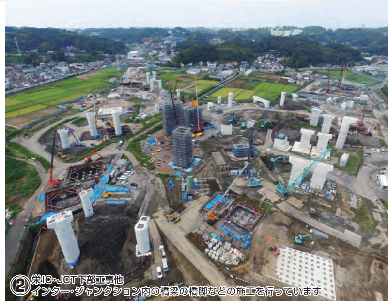
② 栄IC・JCT下部工事他 インター・ジャンクション内の橋梁の橋脚などの施工を行っています