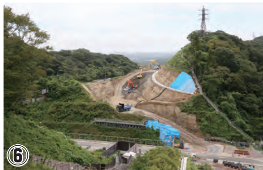
⑥ 釜利谷ジャンクション工事 ジャンクション内新設ランプ部分の切土工事を行っています