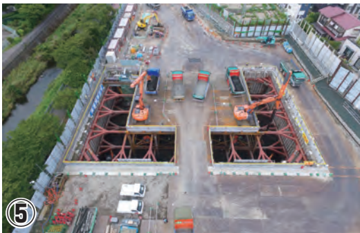
⑤ 公田笠間トンネル工事 発進到達立坑の掘削を行っています