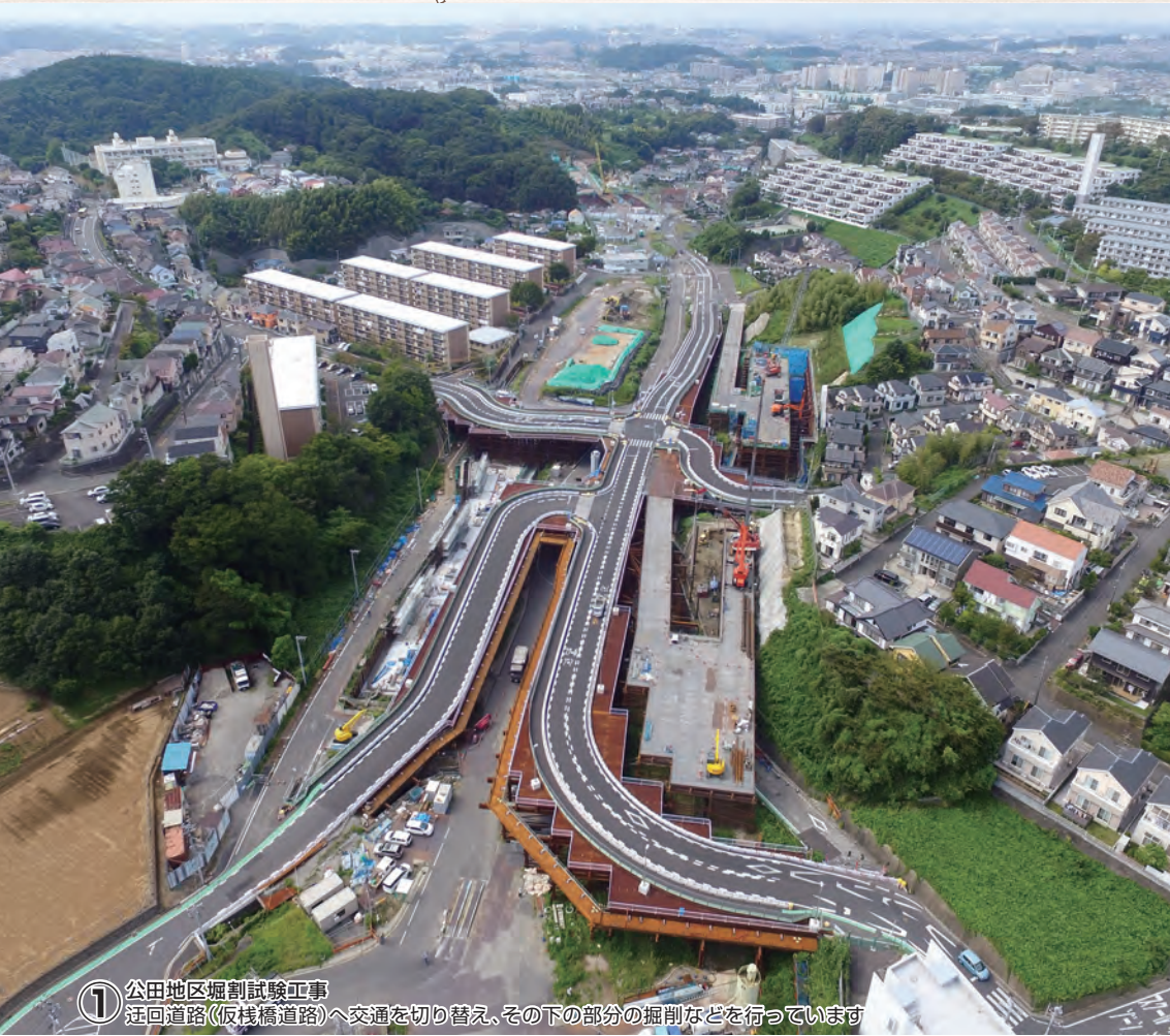
① 公田地区掘割試験工事 迂回道路(仮橋道路)へ交通を切り替え、その下の部分の掘削などを行っています