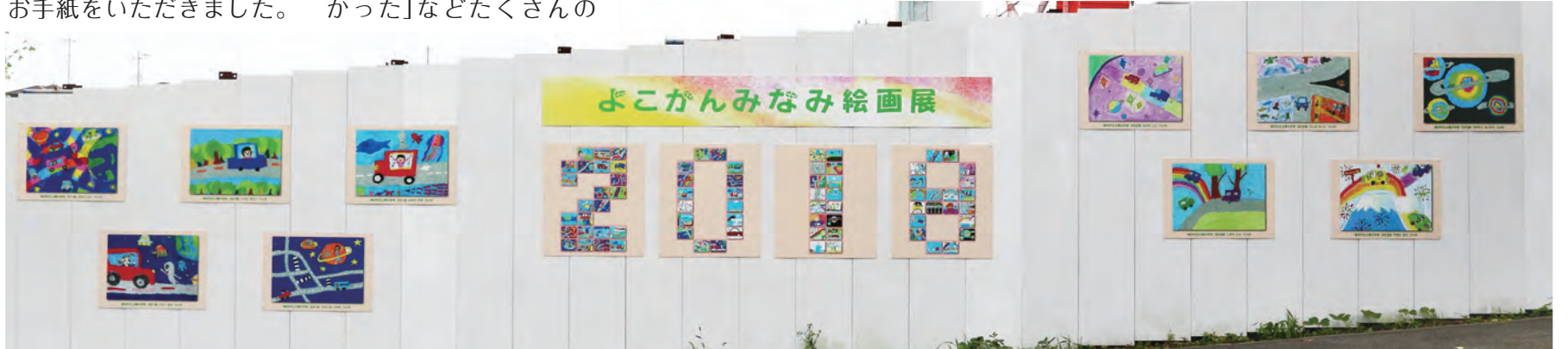
▲全部の絵を展示したいのですが、10点だけ選んでいただきました