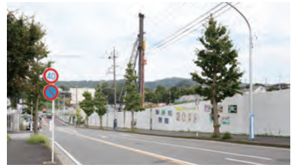
▲工事現場の仮囲いに展示しました