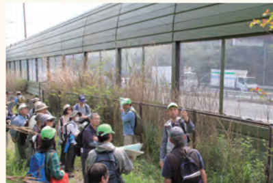
騒音計を用いて遮音壁の効果を数値で確認しました