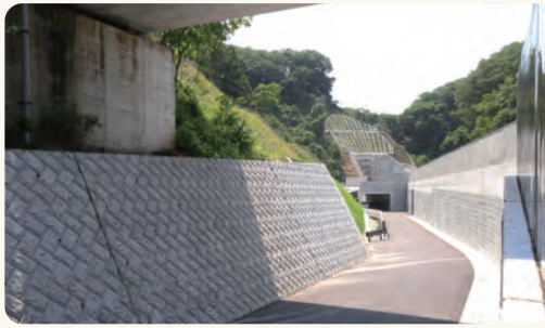
新しく完成した遊歩道

今後もよこかんみなみの工事の進捗により、一時的に閉鎖をする場合もありますので、ご利用される皆さまへはご迷惑をおかけいたしますが、ご理解とご協力をよろしくお願いいたします。