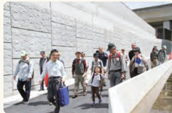
釜利谷ジャンクション内に開通したばかりの遊歩道

※<エコロード>とは、「環境への影響を緩和する」「自然環境を創出・復元する」という2通りの方法で、自然にやさしい道づくりを行うことです