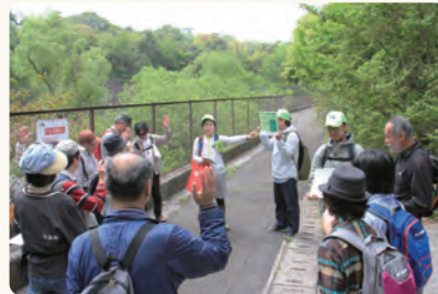
各所でエコロードや動植物に関連したクイズを楽しんでいただきました