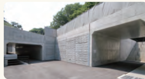
右が清戸の広場、左が新ひょうたん池から大丸山方面