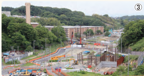
▲ ランプ部分の掘割工事区間。右下に迂回道路(仮栈橋道路)の橋脚となる鋼材が立ち並び始めました ※番号は上記地図の撮影位置。平成28年5月20日撮影