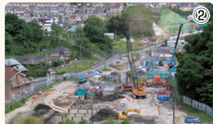
▲ 手前が高速道路本線部分の掘割工事区間。地下水対策の井戸を掘る工事を行っています