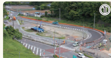
▲ 迂回道路(仮栈橋道路)設置のために現道を迂回させました

※試験工事とは 実際に構造物を構築することにより、施工に関する様々なデータを収集し、今後の本格的な工事の実施方法などに反映していく工事です。