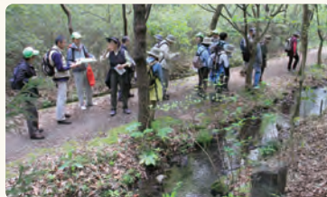
ホテル水路の見学。参加者からは積極的な質問がありました

もこのような活動を通じて、沿線の生活環境や自然環境と共存共生できる高速道路づくりを目指してまいります。