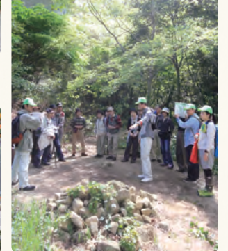
横浜横須賀道路の高架橋下のビオトープを見学。23日には、希少種「エビネ」の花が咲いていました