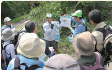
よこかんみなみの概要や遊歩道の工事について説明しました

※<エコロード>とは、「環境への影響を緩和する」「自然環境を創出・復元する」という2通りの方法で、自然にやさしい道づくりを行うことです