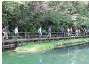
新ひょうたん池での水辺環境創出の取り組みを見学