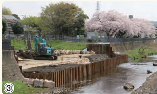
▲飯島地区 河川閉塞工事 いたち川旧河道部の護岸の施工を行っています