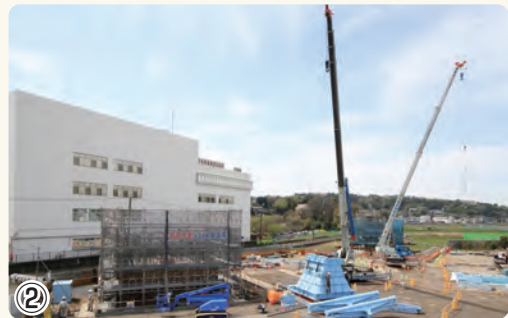
▲横環南栄IC・JCT下部工事 橋脚の基礎の施工を行っています