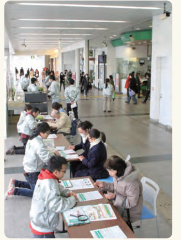
▲クイズとアンケートにお答えいただきました