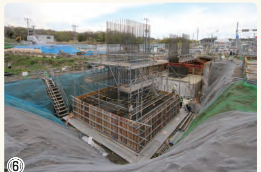
▲桂台トンネル工事 橋梁部の橋脚の基礎の施工を行っています