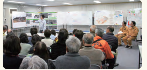
▲現場事務所で工事の内容などを説明しました

今後も、このような機会をもうけることにより、皆さまのご理解とご協力を得ながら、安全第一で工事を進めてまいります。