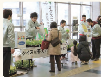
▲NEXCOで栽培したお花の苗をお配りしました