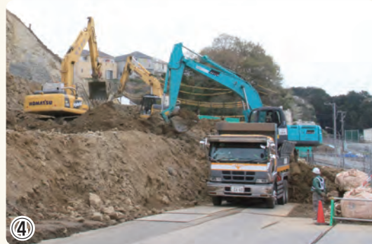
▲公田地区掘削試験工事 切土の施工を行っています