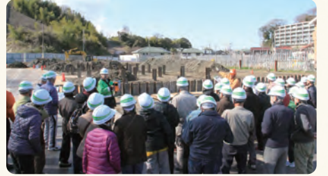
▲土を留める連続壁の施工が終わり、今後、掘削する現場を見学