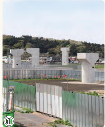
▲横環南栄IC・JCT下部工事 施工が完了した橋脚