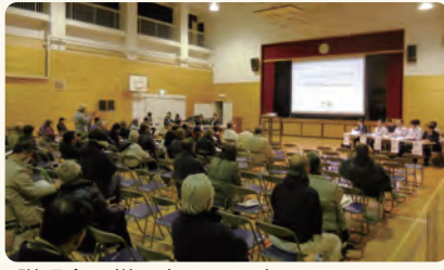
説明会の様子(2月26日)

今回の説明会を踏まえ、工事説明会や工事着手へ向けての準備を進めてまいりますので、ご理解ご協力をよろしくお願いいたします。