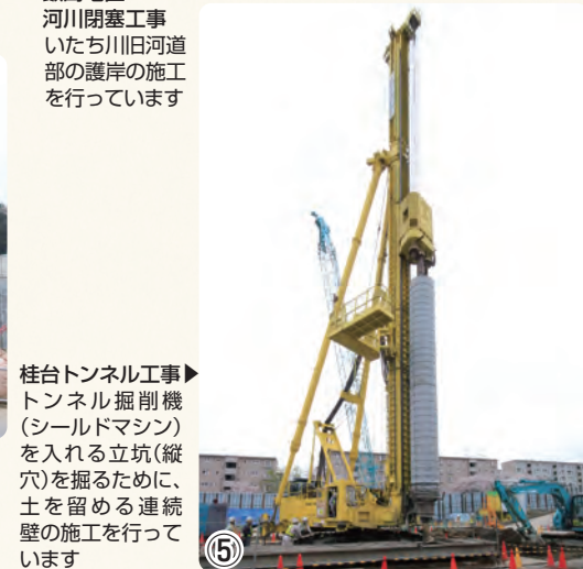
▲桂台トンネル工事 トンネル掘削機(シールドマシン)を入れる立坑(縦穴)を掘るために、土を留める連続壁の施工を行っています