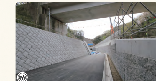
▲釜利谷地区整備工事 遊歩道の整備を行っています