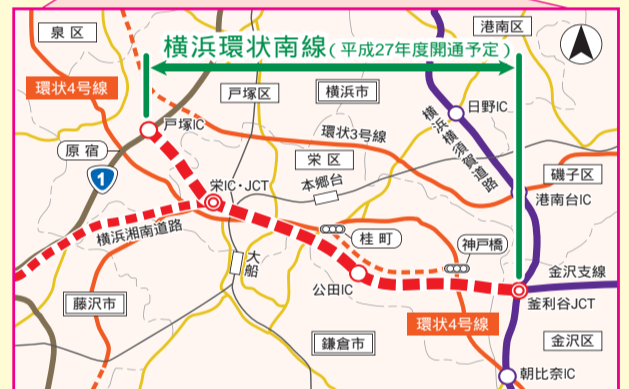
未開通区間のIC・JCT名は仮称です。