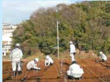
来年度中に約10,000本を植樹の予定

NEXCO緑化技術センターでは、現在もまだ約9,000本の「地域性苗木」を育成しており、来年度中にすべての苗木を公田・庄戸・飯島の各『グリーンセンター』に移植する計画です。