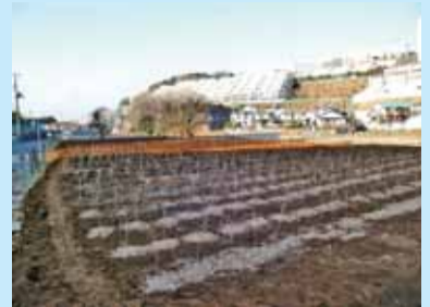
春になると若葉で緑いっぱい