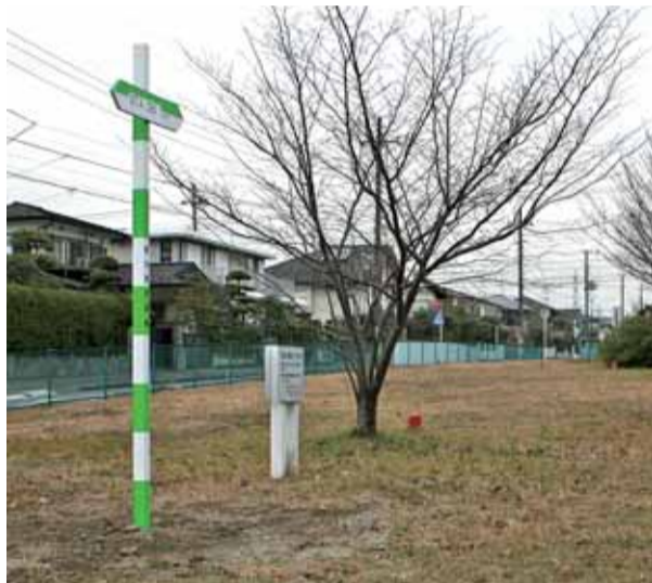
写真左手の緑の標識が、道路の通過位置を示す「路線標識」。地面から赤い部分が見えている短い杭は、道路の中心線となる位置に20mおきに設置した「中心杭」。

またこの地域では先日、横浜環状南線と主要な道路が交差する箇所などに、目印として高さ3mの路線標識を設置しました。地元の豊かな緑とNEXCO東日本の象徴であるグリーンを基調としたこの標識は、道路の通過位置を分かりやすく表示して、住民の皆様を確認していただくためのものです。