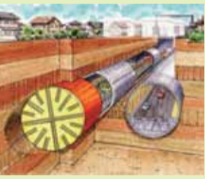
イメージ図(国土交通省資料より)