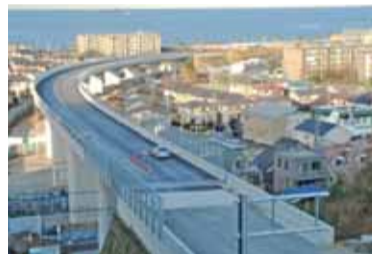
馬堀海岸IC付近の状況(09.1月現在)