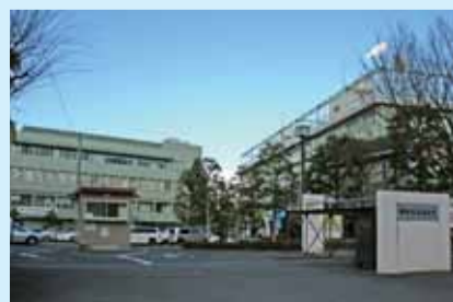
栄区役所はJR本郷駅より徒歩10分

【日程】2/10・24 3/10・24 (すべて火曜日) 【場所】栄区役所 会議室 【時間】午前10時～午後4時 【お問合せ】NEXCO東日本 横浜工事事務所 TEL:045-352-3771 (代表)